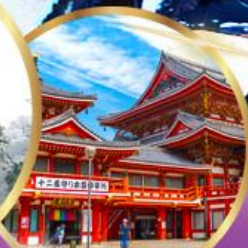
วัดโอสึ คันนง